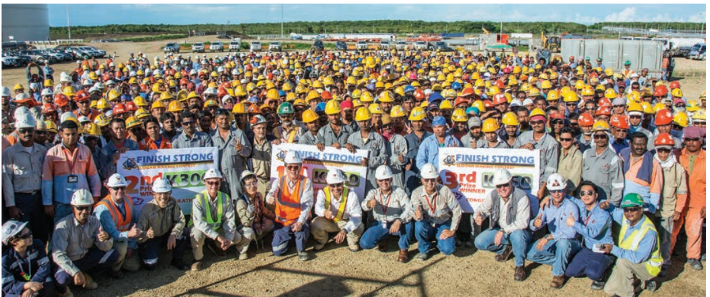
Wanpela bung bilong ‘Finish Strong’ long LNG Plent sait long mun Desemba