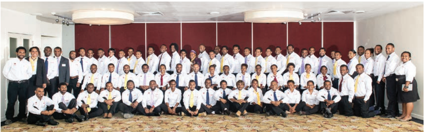
Ol treni bilong Operesens na Mentenens trening program long welkam bek selebresen bilong ol