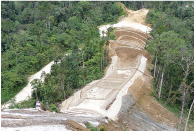
Kontrolim graun i bruk long maunten long rot bilong paipain

Long pinis bilong dispela kwata, wok bilong stretim bek graun na planim ol diwai samting i bin pnis long Homa i go long Paua long Apstrim eria. Na ol wok bilong redi long stretim bek ples long HGCP bai kamap long taim ol konstraksen wok i pinis. Projek i wok long senisim ol banis ol i bin putim bipo long stopim graun i bruk, na nau ol i putim ol strongpela banis inap long stap longpela taim.