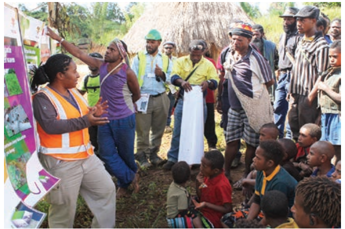
A commissioning and pipeline safety awareness session in Koare

Projek i mekim yet ol wok bilong bungim ol pipel na toktok wantaim ol long ol komyuniti. Long dispela kwata, moa long 7,700 pipel i bin stap insait long 180 fomel bung long 36 komyuniti. Narapela 114 infomel bung i bin kamap long dispela kwata wantaim 1,700 pipel long 20 komyuniti. Long 2013, i bin gat 790 fomel komyuniti engesmen wantaim 38,000 pipel long 84 komyuniti. I bin gat 900 infomel bung long 60 komyuniti wantaim 20,000 pipel.