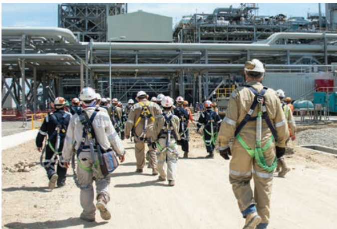
Pinisim las sekap long Train 1 bipo long givim i go long Prodaksen ogenaisesen