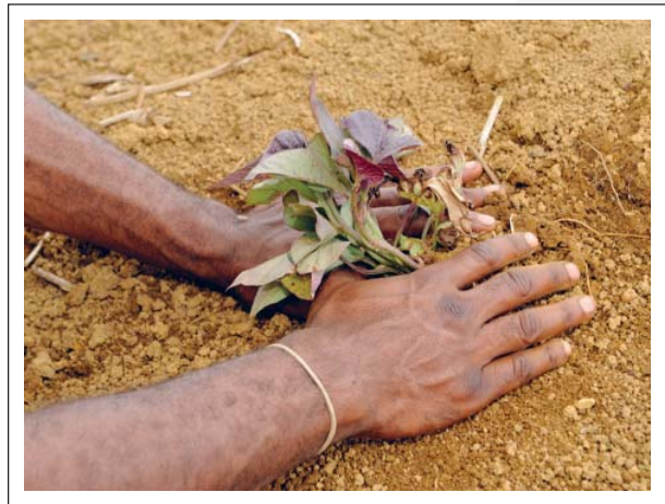
Tokautim na planim nupela kaukau Ipomoea batatas, na ol rop i nogat sik long en

Lukluk i go het long 2011, visin bilong Projek, One Project, One Team, Focused on the Fundamentals . Ol bikpela as tingting ol i makim em: sefti, sekiuriti, helt, envairomen na ol kontrol. Taim namba bilong ol wokman na kontrakta bilong Projek i go antap, em bai wokbung wantaim olsem wanpela tim long kamapim namba wan kaikai bilong Projek, pipel bilong Papua Niugini na planti arapela ol stekholda.