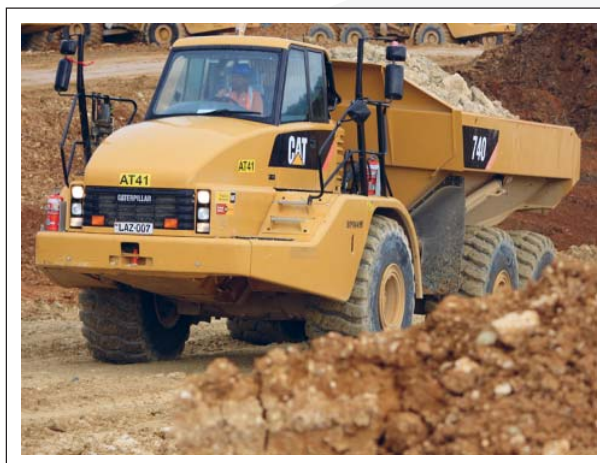
Ol bikpela wok brukim graun i go het yet long Hides Gas Kondisening Plent