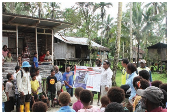
Ol sefti toktok bilong paipain ROW i kamap long Kaiam

Moa long 500 manmeri i stap insait long 200 fomal komyuniti engesmen i kamap long 55 komyuniti long dispela kwata. I kam inap nau, Projek yet i lukim moa long 30,000 manmeri long 1,400 fomal engesmen. Na tu, moa long 400 infomal engesmen i bin kamap long 41 komyuniti long dispela kwata. Givim gutpela toksave long sefti bilong ol lain i wokabaut long rot em bikpela wok i bin kamap long komyuniti engesmen, klostu long HGCP sait. Projek i wok long go het yet long skulim ol lokal komyuniti husat i save bihainim rot bilong ol yet i go long skul na maket long taim ol bikpela konstraksen wok i kamap long dispela eria.