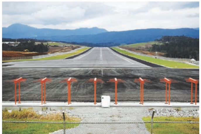
Komo Ples Balus i soim eria we ol i stretim bek ples long tupela sait bilong ranwe

Long Komo Ples Balus, wok bilong stretim bek ples i winim mak bilong 57 hekta long dispela kwata, dispela i karamapim tu eria i stap not long hap we balus i save ran i go long en. Ol wok bilong stretim bek ples i kamap tu insait long banis na long ap bilong Tamalia Riva Baro Pit, we ol i planim samting olsem 14,200 diwai.