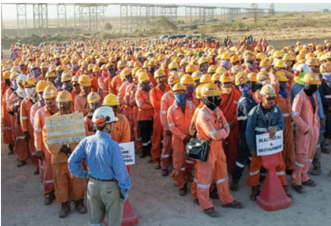
Ol woka i bung long taim bilong imejensi dril long LNG Plent sait

Long taim komisin ges i kamap long LNG Plent sait long dispela kwata, em i kamapim tu ol nupela sefti fokas bikos sampela hap bilong dispela fasiliti em i gat haidrokabon o ges i stap long en nau. Bipo long dispela komisin ges i bin kamap, samting olsem 8,000 LNG Plent sait konstraksen woka i bin stap insait long imejensi dril long kisim save long wanem kain imejensi inap kamap long ol ges na arapela haidrokabon. Dispela dril i bin kamap gut na ol woka i ken karim save ol i kisim long en i go bek na bihainim long taim bilong komisin na prodaksen. Bipo long ol woka i ken kisim tokorait long go insait long eria we i gat ol haidrokabon long en, ol Projek woka i mas kisim trening long Prodaksen Wok Manesmen Sistem bilong Esso Highlands Limited pastaim. Na bihain long en bai i orait long ol i mekim wok konstraksen long taim ol i wok long ples we i gat ol haidrokabon long en.