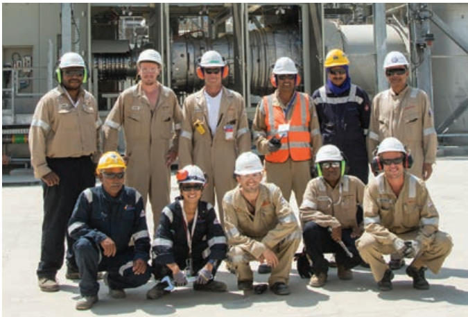
Tim bilong Sistems Komplisin na Operesens i statim tripela bilong ol sevenpela jenereta long LNG Plent yutilitis eria