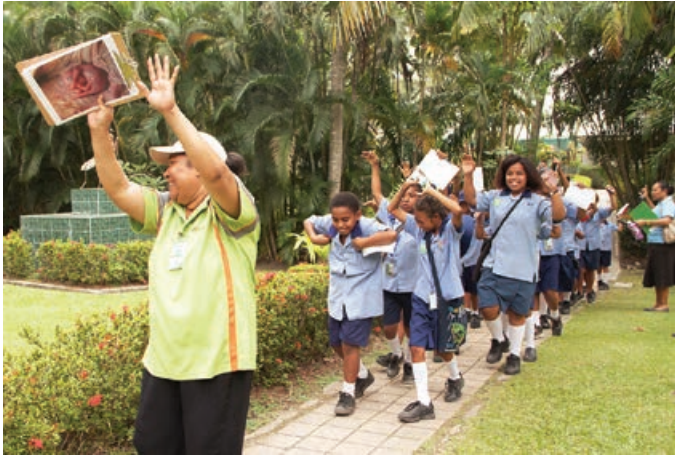
Ol studen i traim wokabaut olsem grasop long taim ol i go lukluk raun long Port Moresby Nature Park

Ol kontrakta tu i mekim wok bilong helpim ol skul. Wanpela eksampel, wanpela driling kontrakta i givim kompyuta trening long ol haikul tisa long Hela, na i givim ol fisiks, kemistri na baioloji teksbuk long ol studen. Narapela kontrakta i givim 20 bokis buk bilong prektis long rit long tok Inglis i go long faipela elementeri na praimer skul long Apstrim eria long dispela kwata.