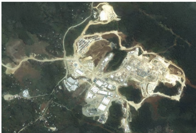
Lukluk i go daun long Hides Ges Kondisening Plent