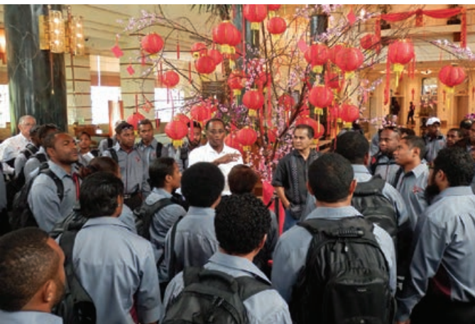
Ol Operesens na Mentenens treni i kamap long Malaysia

Long redi long prodaksen wok bilong Projek, namba tu intek bilong ol Operesens na Mentenens treni bai statim Advens Skills trening long Malaysia bihain long ol i greduet long Besik Skills Trening program long Pot Mosbi long dispela kwata.