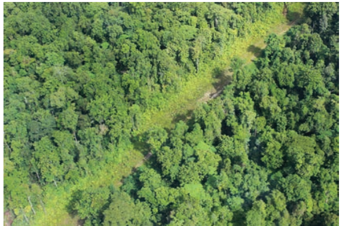
Ples we ol i bin kliam long putim onso paipain ROW

Long taim konstraksen wok klostu i pinis long Komo Ples Balus, kontrakta i wok long lukluk long stretim gen graun na ples. Ol dispela wok i karamapim pinis 10 hekta graun long pinis bilong dispela kwata. Onso Paipain kontrakta i strongim wok bilong lukautim graun i stap antap na arapela wok long na i givim trening na toolbox toktok wantaim ol woka bilong en.