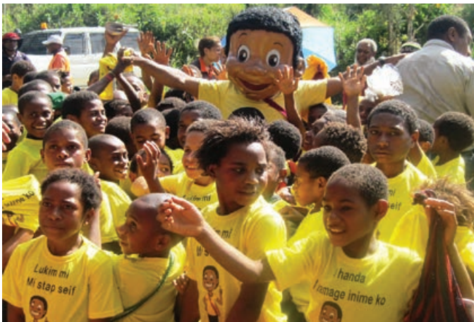
Toea i go raun long Waru Praimeru Skul

Long taim Projek i kamap klostu long ol prodaksen wok, em i luksave tu long pasin bilong strongim gutpela wokbung namel long olgeta stekholda. Dispela gutpela luksave bai kamapim gutpela kaikai bilong Projek, tasol bikpela samting moa, bai em i soim olsem Papua Niugini em i wanpela kantri long wok bisnis wantaim long wol na ol wok bilong kamapim ikonomi bilong en i ran gut wantaim gutpela pasin bilong konsevesen.